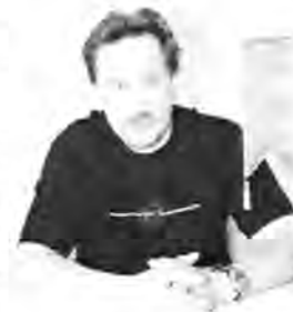
Nedtecknat av Micke Täll, ordförande Klubb Årsta

riksdags- och kommunalval 2002 och 2006 skall inom Stockholms län fler bli valda från SEKO. Det är också viktigt att vi röstar, det är när vi avstår från att rösta som motgångarna kommer politiskt. Då blir andras röster mer värda. Vi är flera än de andra, låt oss visa det på valdagen!