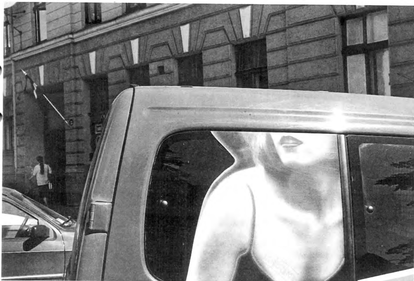
Efter flera timmars promenad på Rigas gator