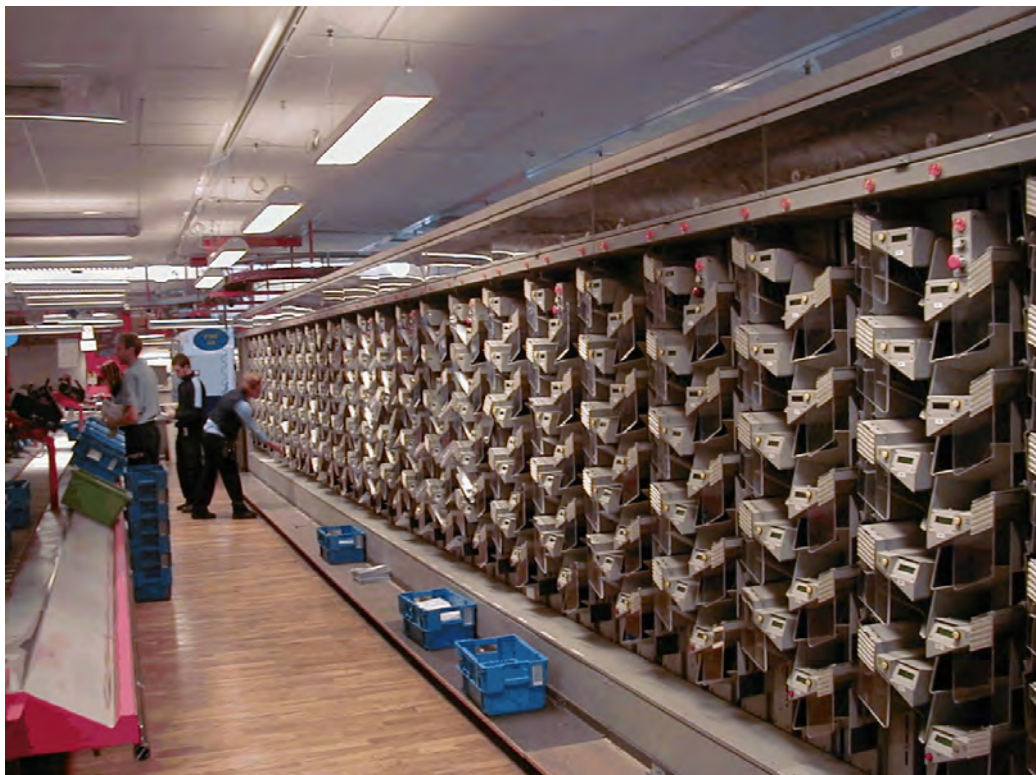
...och här en FSM på Västeråsterminalen!

Systemet uppges fånga upp 99,97 procent av eventuella smittämnen som t.ex. Anthrax.