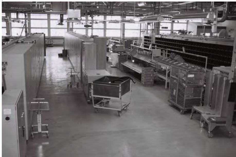
Bild på denna och föregående sida: FSM:arnas eftertraktade område på Årstaterminalen.

En bullerfri arbetszon - med bullerdämpande skiljevägg mot övriga maskinhallen - skapas i den mest attraktiva delen av plan 2 som i dag hyser sju FSMer, med "lågsåsong" dagtid (samt oordnade lager av trasiga stolar och julresningsbord!). Även terminalkontorets angränsande lokaler bör inkluderas. Administrationen flyttas bort från produktionsplanet, FSMerna till tomrummen efter KSM/Klump.