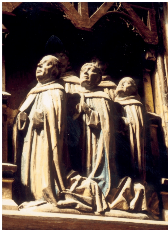
Utan några jämförelser i övrigt. Motiv från Birgittaaltarskåpet i Vadstena klosterkyrka, 1400-tal.