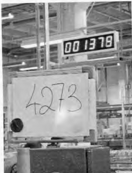
Ett område på Kungsholmen med 4.273 avlämningsställen bladas. Räkneverket i bakgrunden hjälper operatören att hålla kollen.

• Gruppreklamen har i långa tider varit en viktig affär för Posten. Den som har sina rötter i 60- och 70-talets brevbäring vet att det redan då fanns mycket reklam att dela ut för den brevbärare som ville tjäna extra pengar. I början av 90-talet började Posten köpa in bladningsmaskiner och hela utdelningssystemet lades om. Från att huvudsakligen ha varit ett frivilligt extraknäck blev utdelningen ett obligatorium som lades in i ordinarie tjänstgöring samtidigt som betinget togs bort. Gruppreklamen - eller oadresserad reklam, ODR, som den kallas numera - ökade och blev allt viktigare för Posten när de vanliga brevvolymerna