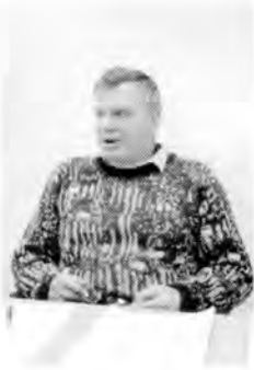
Text: Jan Höglin Ill: Robert Nyberg

Detta står inte i den svenska arbetarklassens intresse. För att bevara ett oberoende fack. För att inte släppa mer makt till EU, kräv folkomröstning om EUs nya grundlag!