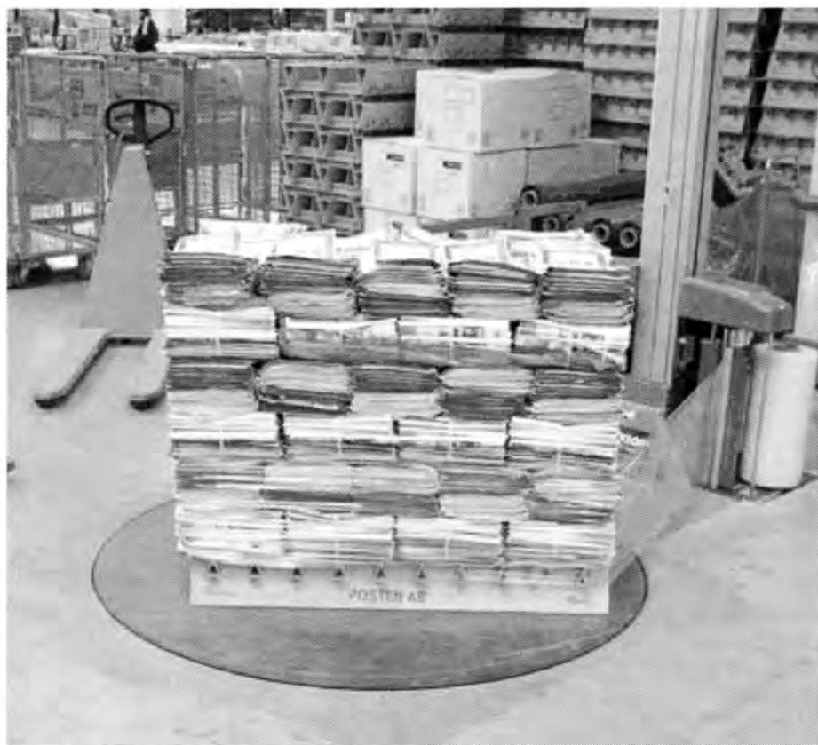
Ovan: En färdiglastad pall plastas in. Nedan: En pall med “Svepet”.