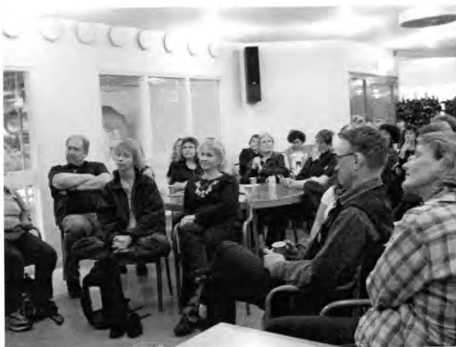
Fullsatt i matsalen på Årsta..... .....när Marika Lagercrantz uppträdde.

Personligen blev jag riktigt överraskad av hur rolig Marika var att lyssna till! Det hade jag nog inte riktigt väntat mig... Men det var ett väldigt lyckat framträdande och jag hoppas att vi