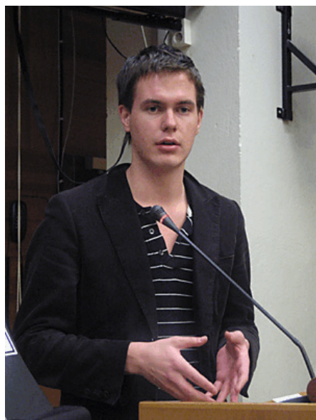
Inbjudna politiker: Lars Ohly (v) och Gustav Fridolin (mp).