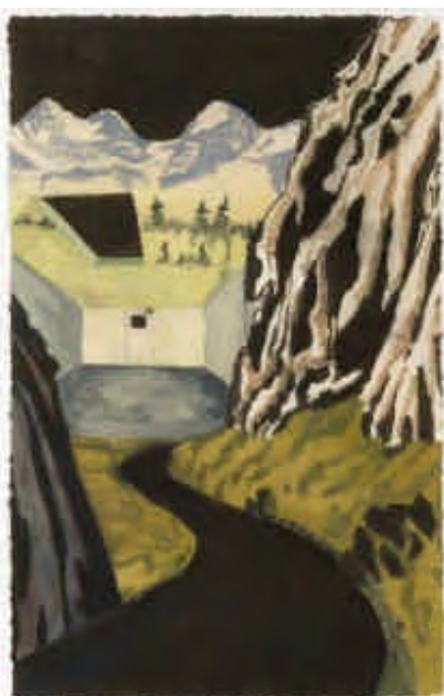
Karin Mamma Andersson Till Elfriede Jelinek, 2006

gratis gruppbesök med guidad visning för medlemmar i SEKO