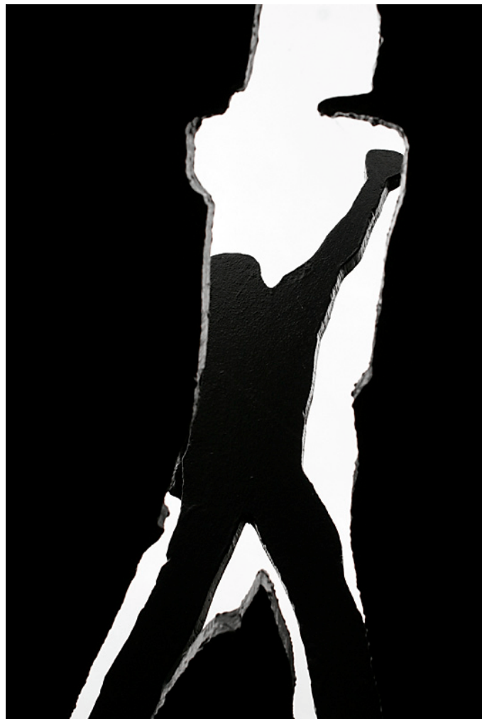
“Mänsklig kommunikation” av Jörgen Fogelquist. Den vackra och kraftfulla skulpturen pryder uteplatsen vid Malmö postterminal.

För att undvika uppsägningar kommer pensioner att erbjudas på Årsta. /Red.