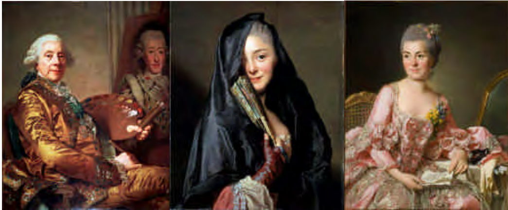
Alexander Roslin Självpporträtt med palett, 1790