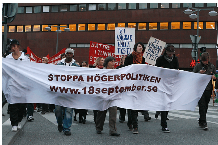
Demonstrationen den 18 september mot regeringspolitiken samlade 5.000 deltagare.

Jag är övertygad om att det här tygellösa tillståndet inte gynnar de anställdas intressen och att den bristande kontrollen av efterlevnaden av reglerna betydligt försvårar arbetet för en bättre arbetsmiljö i Segeltorp. En kostsam investering i avlastningsmattor vid sorteringsborden har till exempel till stora delar blivit ett misslyckande, då man på flera håll har förstört mattorna med ovarsam truckkörning och pallhantering. Många av mattorna har vi redan varit tvungna att ta bort och fler kommer att försvinna av samma skäl. Typiskt är att mattorna av allt att döma har förstörts av truckförare och andra som inte behöver dem, då de själva aldrig