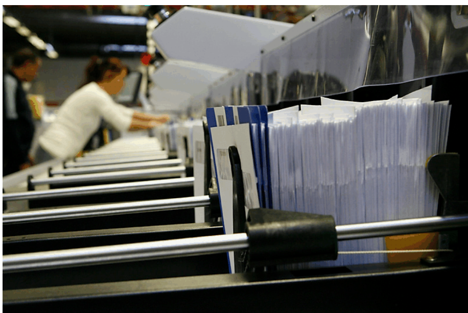
Bilder från BFM-utbildningen 19 september. Ovan: Utsikt från sista stapeln. I bakgrunden Sussie Lantz.