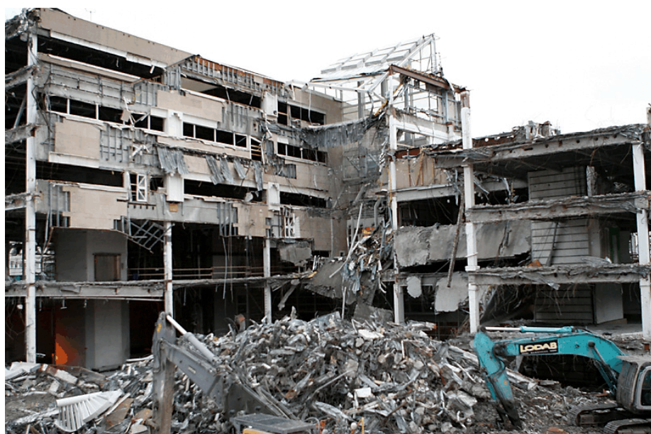
Stockholm Klara den 2 februari 2008.

Den svenska arbetsmarknaden har strukturella brister. Det förekommer ofta att kvinnor arbetar mer i osäkra anställningsförhållanden än män och att de arbetar mer deltid. Det finns kvinnodominerade yrken där lönerna är låga och där det är få förmåner, lite frihet att kunna ta en kort paus och gå ifrån arbetet på arbetstid. I stort sett i alla LO:s branscher har arbetssituationen förändrats pga. ökad konkurrens, otrygga anställningar, privatiseringar och bolagiseringar. Detta har påverkat arbetsklimatet negativt och medfört mer stress, sämre arbetsmiljö och ett mer ojämnt arbetsliv mellan arbetare och tjänstemän, mellan kvinnor och män. LO-rapporter Röster om facket och jobbet visar att nu är det mycket viktigt att det fackliga engagemanget förblir fortsatt starkt och att fler engagerar sig i det fackliga arbetet samt att medlemstappet minskar. Det är en utmaning att värva och serva medlemmar, att informera om medlemskapets värde, att utbilda och få fler fackligt förtroendevalda och den "pucken" måste de förtroendevalda fånga. Det tar tid att förändra och förbättra förhållandena på arbetsmarknaden. Den enda vägen att gå är genom ett fackligt och politiskt arbete.