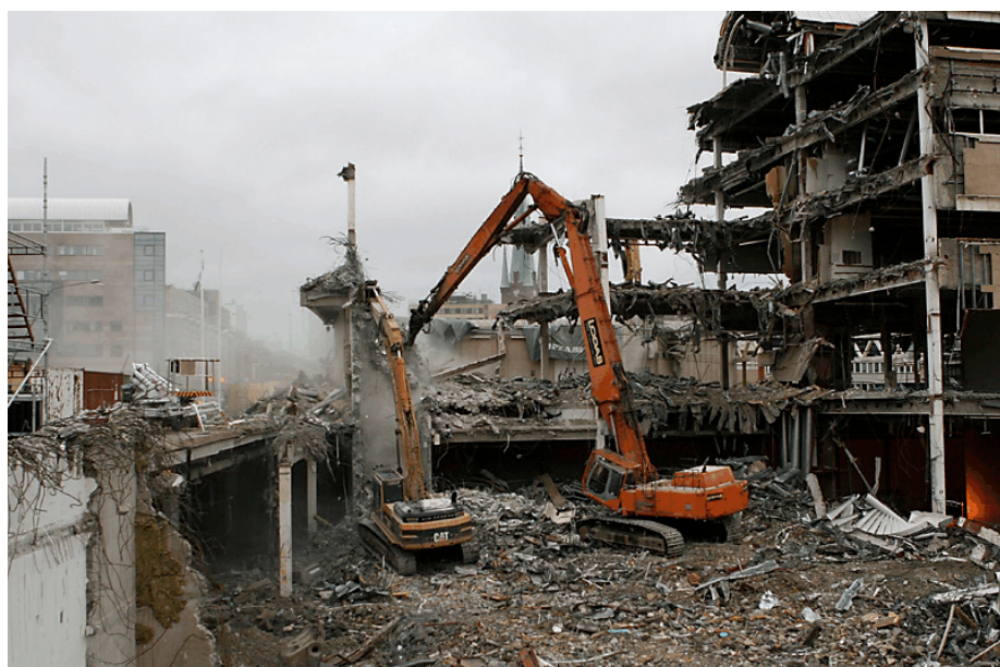
Stockholm Klara den 2 februari 2008.