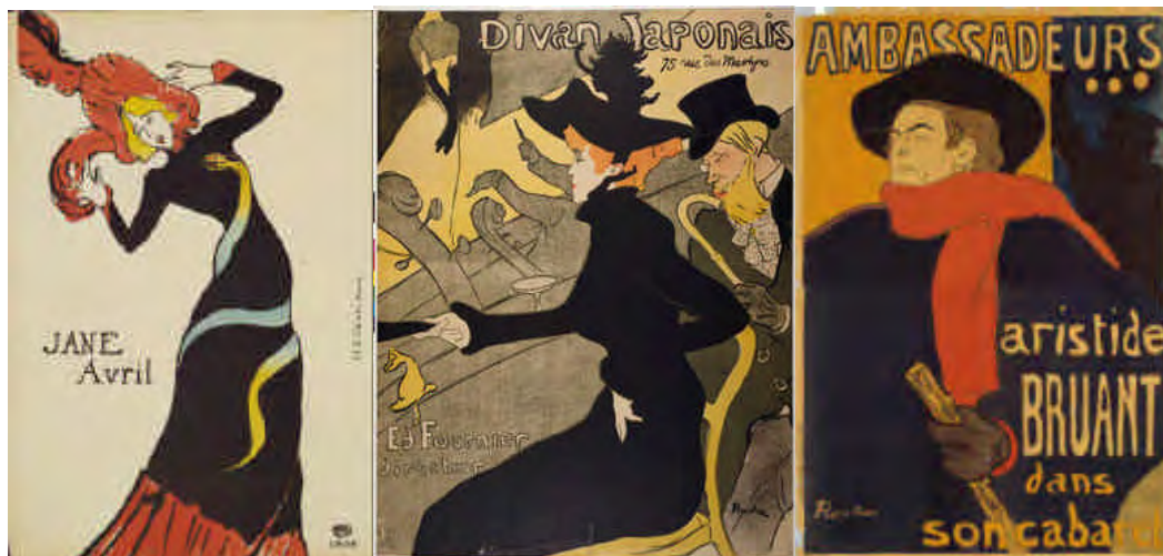
Jane Avril, 1899