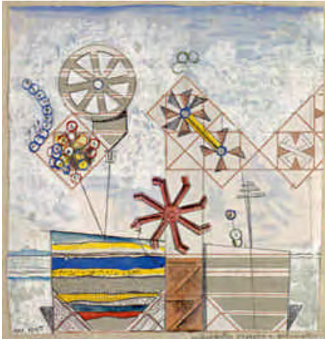
Kvinnokroppens isandskap, istappar och stenarter, 1920