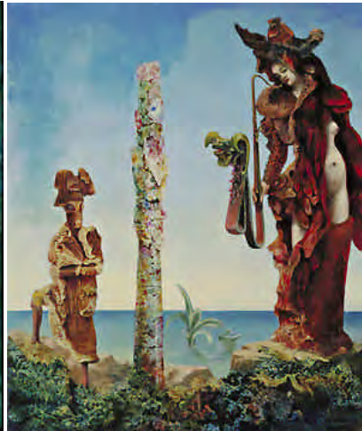
Napoleon in the Wilderness, 1941