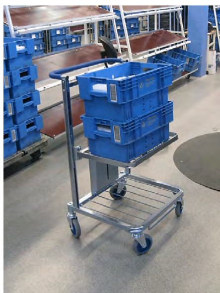
En ny typ av "palettagn" som testas, med automatisk höjning av lådorna.

ingår för att alla ska lära sig att arbeta på rätt sätt och fullt ut utnyttja sorteringsfackets fördelar. Vi provade på att sortera lite i både små- och storbrevsfacken och det kändes bra men självfallet gav det mest att lyssna på vad personalen som arbetat vid de nya sorteringsfacken tyckte om dessa även om facken inte funnits på plats särskilt länge i Karlstad. Genomgående var personalen mycket nöjd med de nya sorteringsfacken, vilka man bedömde som klart bättre än de gamla modellerna. Här måste man dock ha i åtanke att man på Karlstadterminalen tidigare inte haft höj- och sänkbara fack, vilka självfallet upplevs som en fördel i sig.