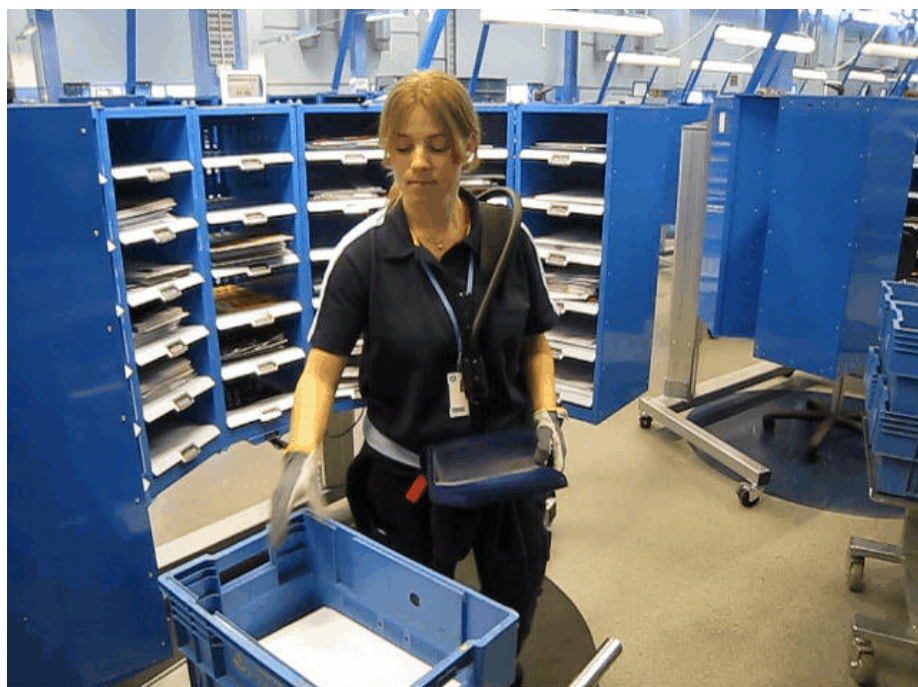
Överst. Två ståstolar testas. Dels samma typ som vi provat på Årsta, dels denna "sadelstol". I bakgrunden småbrevsfacket. Nedan: Det hjälpmedel som följer med facken och som används som stöd för försändelserna för att underlätta belastningen.

typ till lådvagn med fjädring som det gick att lasta fyra lådor på och som är lätt att köra. Vi hann också med att se på en ny ALA/ALO med 20 riktningar och den nya typ av stämpelmaskin som nu även finns på Årsta.