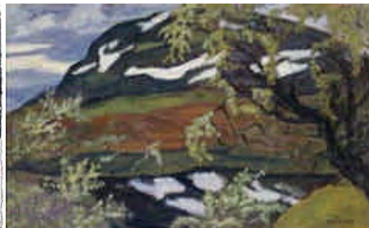
Helmer Osslund Midsommar Nuolja, 1922

gratis gruppbesök med guidad visning för medlemmar i SEKO Klubb Årsta