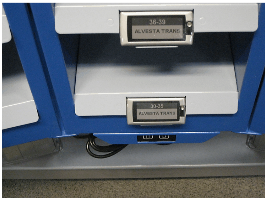
Överst storbrevsfacket. Notera displayen ovanpå facket där utslagstider kan anges. Nedan: Fackdisplayerna.

reflexer, främst från själva fackbelysningen, i displayerna. Man arbetar med frågan och hoppas kunna lösa problemet genom att vinkla ned de två översta raderna där besväret upplevs som störst. Själva placeringen av displayen kanske inte heller är helt optimal men lyckas