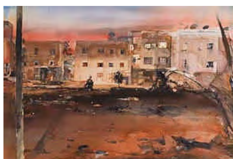
Lars Lerin Marocko, 2007