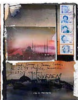
Lars Lerin Vykort, 1993