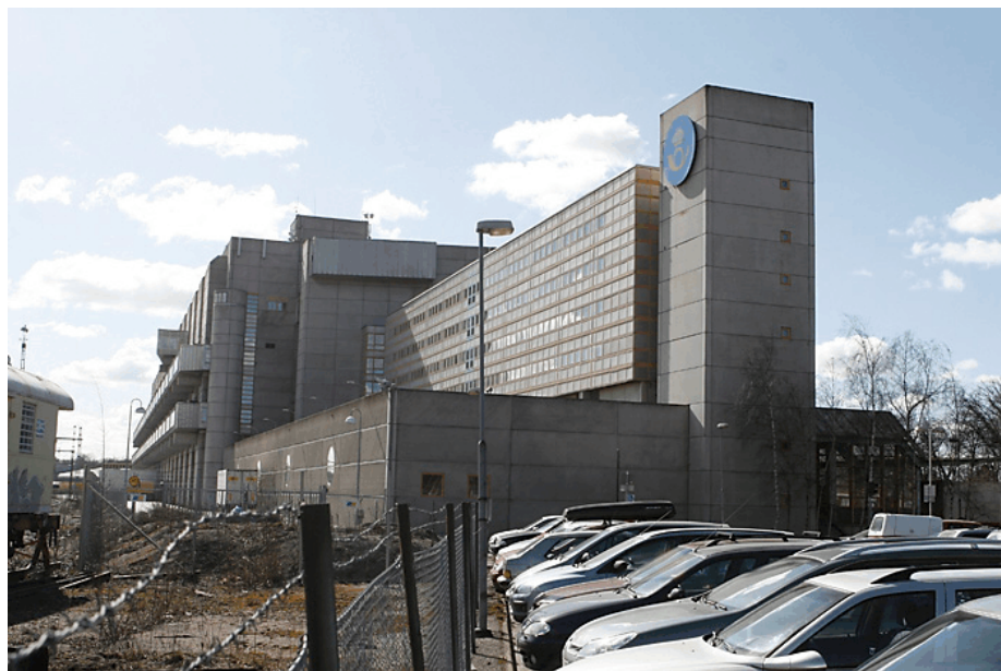
Nu hotas återigen Tomtebodas välrenommerade gym.

personalchef ska agera och ta hand om personalen på ett föredömligt sätt. Så det känns trist att personalansvariga i nya organisationen inte ser det på samma sätt.