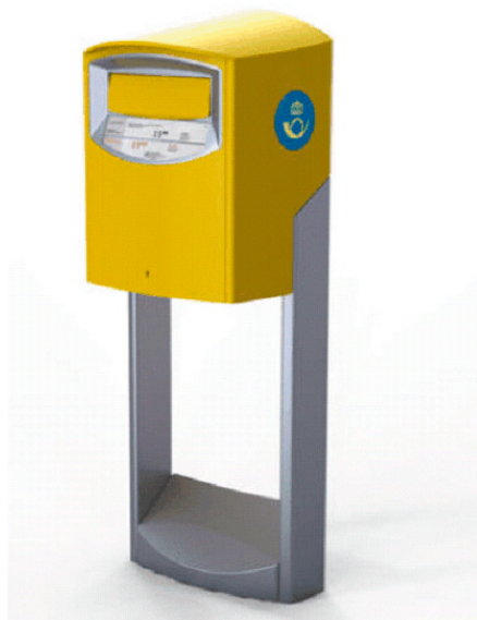
Den nya brevlådan – som det ska bli färre av.

Som bakgrund för Postens senaste effektiviseringsprojekt har man enligt alla konsultens regler gjort en gedigen och omfattande marknadundersökning, angående svenskarnas brevlådevanor. Det visar sig att det är en minoritet som över huvudtaget nyttjar brevlådor. Den allra största