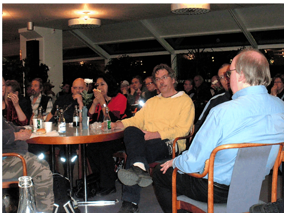
Sektionerna höll infomöten i samband med överskottsförhandlingarna. Nattens infomöte den 22 april.

Som i alla förhandlingar är det att ge och ta. Vi kan bara konstatera att det var SEKO klubb Årsta som var den fackförening som drev kravet på att omställningsavtalet skulle gälla. Om inte vi så starkt med stöd av SEKO centralt hävdade att omställningsavtalet ska gälla så är vi övertygade om att antalet pensionslösningar skulle ha blivit långt färre.