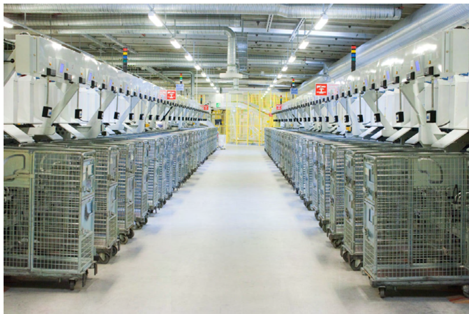
Problemen i Årstas pilot-KSM är långtifrån lösta.

man att testa en annan typ av upphängning av säckarna och förslutning och märkning av dem. Uttransporten av säckarna från maskinen är tänkt att gå på lådbanan till en säckskiljare. Det som återstår är en