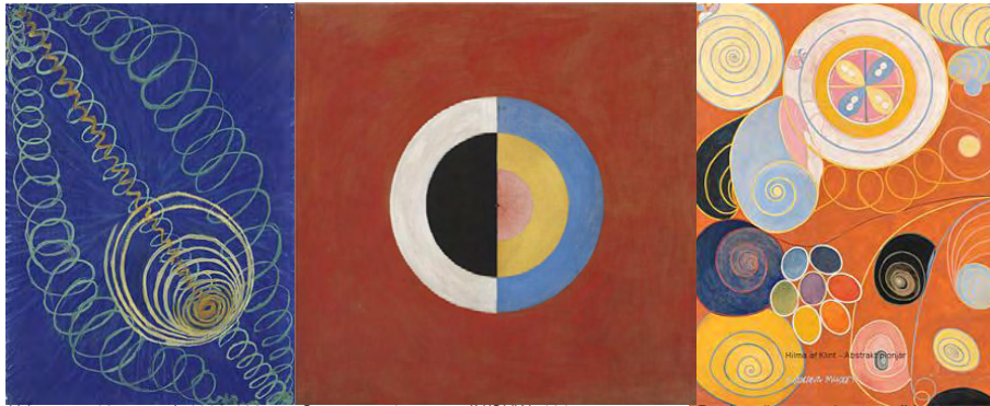
Urkaos, nr 16, grupp I, 1906-1907