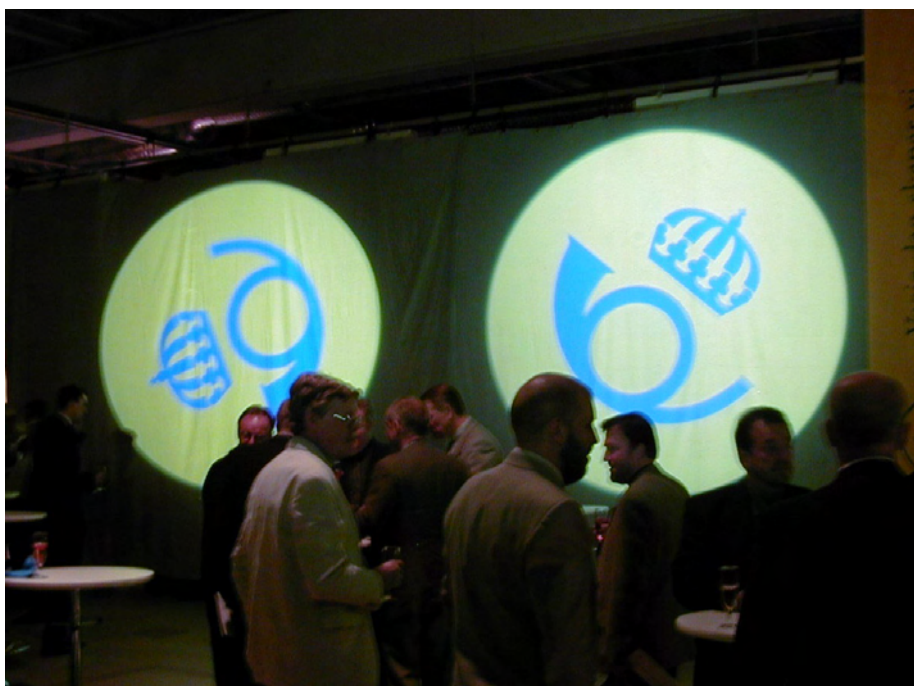
Från invigningen av nya Årstaterminalen 22 maj 2000.

Dels kräver man tydligare regler för att