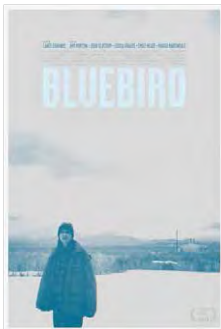
Film: Bluebird . Skrivnen och regisserad av Lance Edmands .

riktigt veta hur det slutar även om det antyds ett hopp i slutscenen, att helt bryta samman. Allt ställs på ända för denna hårt arbetande familj, dessa vanliga amerikaner , som vi säger litet slarvigt, som försöker stötta varandra: Richard och dottern sin hustru och mamma, Richards chef Richard, den lilla pojkens mormor hans unga mamma, som själv är så sårig (som 17-åring förvägrades hon av sin troende mor att göra abort; denna religiösa extremism är också USA) att hon inte riktigt klarar av att ta in det som har hänt. Därför blir hon också ett