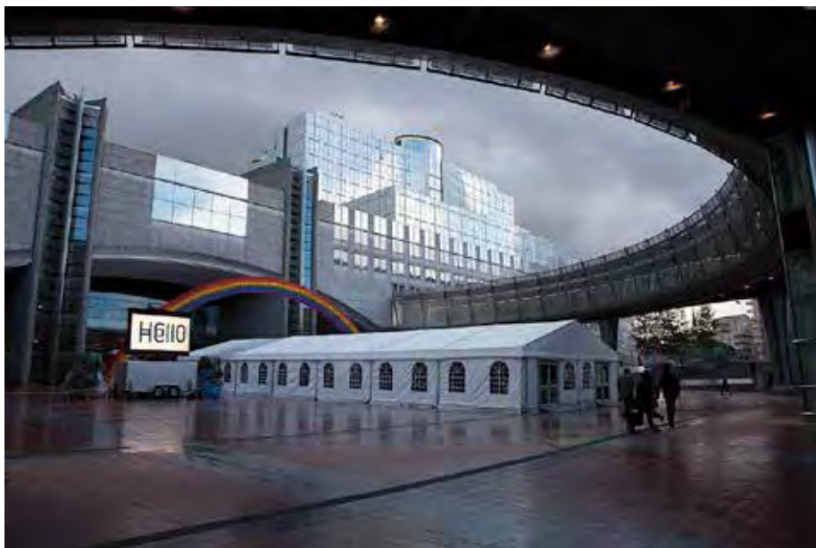
EU-parlamentet i Bryssel, oktober 2011.

ringen att den formellt inte handlade om privatiseringen utan om villkoren i de nya avtalen. Eftersom förhandlingar inletts och en uppgörelse ansågs möjlig behövdes därför ingen strejk. Bakom detta beslut finns en vidare förklaring. Vid brittiska LO:s (TUC) kongress 2013 antogs en motion som gav labour mandat att åternationalisera Royal Mail om högerregeringen privatiserade det. Labours konferens ställde sig bakom TUC:s beslut. MEN –