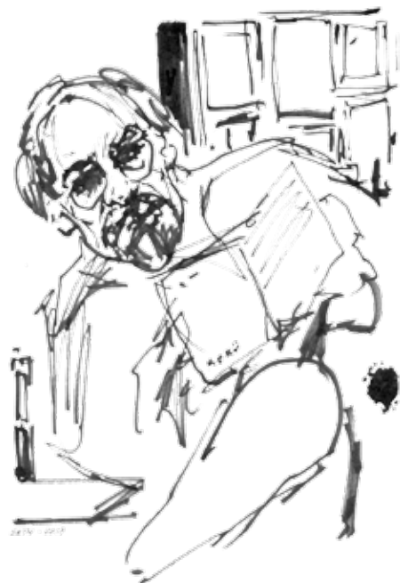
SETH - 2010