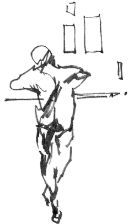
SEKOS INFO. SETH - 2010