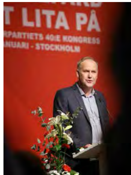
Vänsterpartiets ordförande Jonas Sjöstedt

Solidarity for all är en gräsrotsorganisation med kopplingar till det grekiska vänsterpartiet Syriza. De hjälper på ett praktiskt sätt de som har drabbats av krisen.