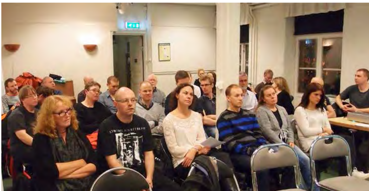
Årsmöte med Seko Postsektion Skärholmen-Hägersten

Vikten av att jobba rätt var en punkt som flera återkom till. Att jobba rätt blir ett sätt att visa Posten var gränsen går. Genom att jobba rätt, och genom att använda skyddsorganisationen för att sätta press på Posten att fixa så att de rutter som är för långa kortas ned, ska brevbärarna tillsammans med skyddsombuden och den fackliga organisationen på båda kontoren försöka skapa det tryck på ledningen som behövs för att denna ska inse