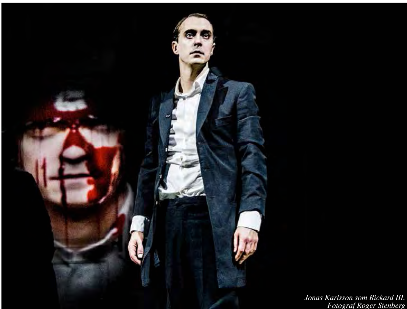
Jonas Karlsson som Rickard III.