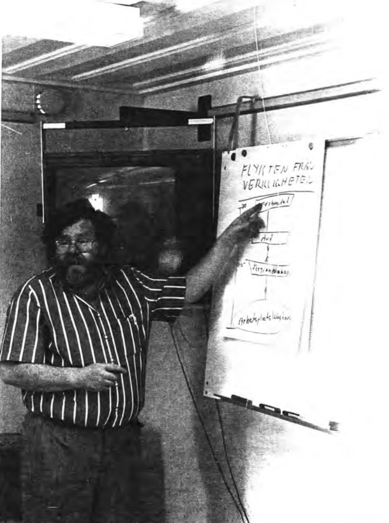
Regionklubbstyrelsen diskuterar förslaget till ny organisation inom Statsanställdas Förbund. Brodde Zetterlund illustrerar.