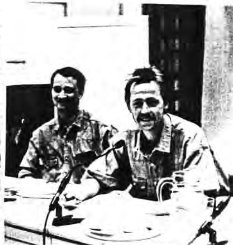
Övre bilden: Medlemmar i Norrtäljeklubben