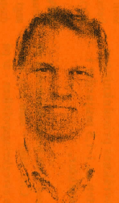
Gunnar Howding Ersättare Biltransporten