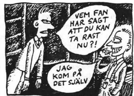
Ill: Robert Nyberg