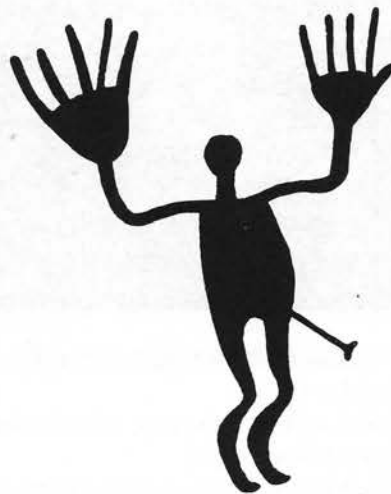
Fotbolls-VM: Målvaktsdröm. Hällristning från Backa, Bohuslän.

Posten bär sig mer och mer åt som vilket bolag som helst! Visserligen statsägt - men på väg mot det som bolag är till för: vinstmaximering.