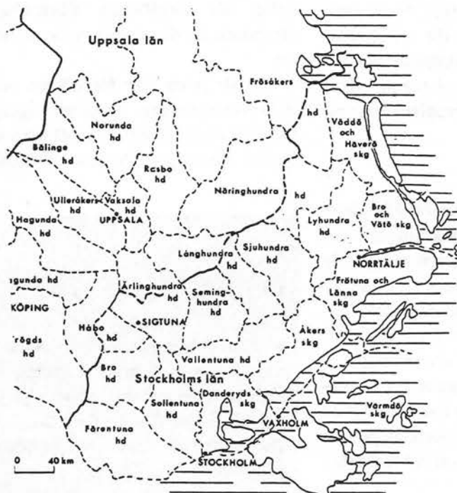
Illustration: Upplands indelning i härader och skeppslag.

rad. Av tidsbrist skrevs manus för hand, av sonen (min egen alltså) utskrivna på diskett, utprintad för korrläsning, korrläst, rättad och sedan mailad till redaktören. Någonstans i "processen" så går då den orättade versionen iväg! Nittonhundranitiofyra återupprättades för en dag - med anledning av 200-årsminnet - den optiska telegraflinjen mellan Stockholm och drottningholm. Tillförlitligheten visade sig vara av ungefär samma klass som ovan relaterade datakommunikation! "Jag är skeptisk till denna tro på datorer!, som min vän civilingenjören Borg brukar säga.