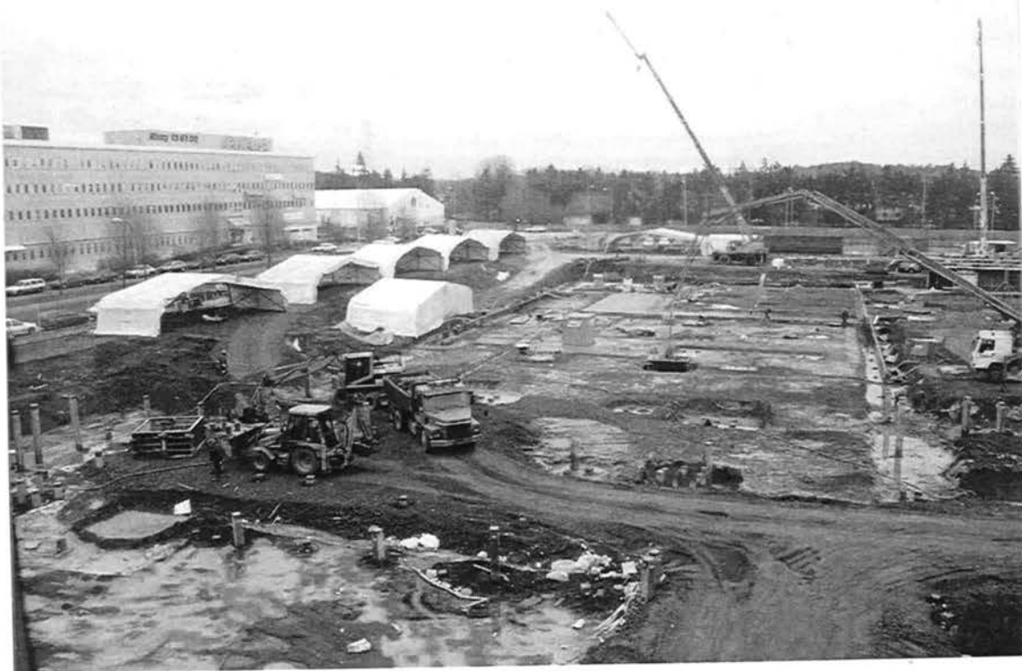
Stockholm Syd, kl. 12.00 den 21 januari 1999. Utsikt från nuvarande byggnad mot öster.