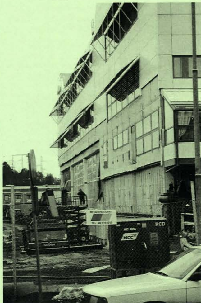
Sth Syd, kl. 11.50 den 21 januari 1999. Samtidigt som bygget pågår med högsta fart planerar Pensionsstiftelsen en försäljning.

Läs mer om bakgrunden till försäljningen på sid 11 samt i intervjun med Bertil Nilsson på sid 6.