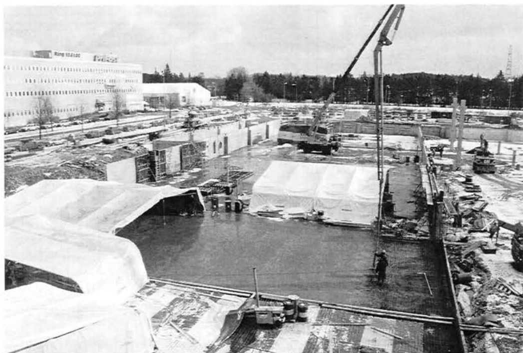
Sth Syd kl. 13.30 den 9 mars. Utsikt mot öster från nuvarande byggnad. Gjutning av bottenplatta.