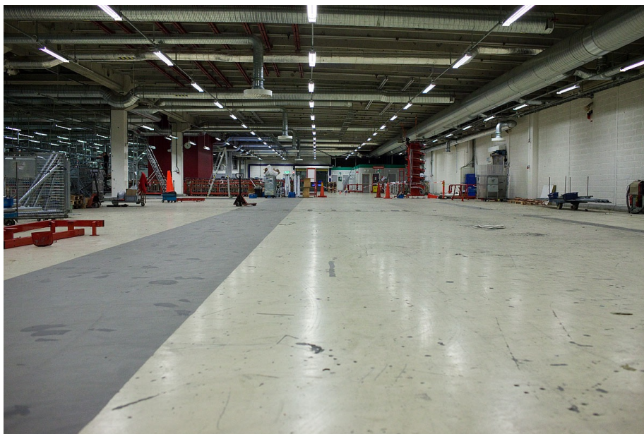
Årsta den 10 februari 2011: Här kommer den nya KSM:en att installeras i slutet av februari ... och så här kommer den att se ut (nedan). Notera storleken i jämförelse med SSM 38!

Under året har arbetsgivaren arbetat med att öka andelen sorterat i maskin och förädlingsgraden i våra maskiner. Det har också varit tester på samsortering av A- och B-post. Allt för att det ska komma så mycket förädlad post som möjligt ut till brevbärarkontoren. SEKO klubb Årsta har under hösten bjudit in Tommy