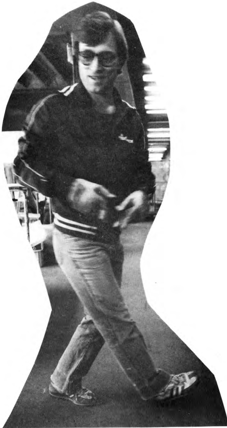
Täby 1, det dansanta kontoret