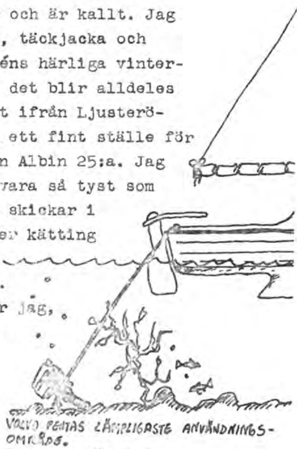
VOLVO PENTAS LÄmpligaste användnings-område.

ljutt flammorna som letar sig ut genom rufföppningen. Kanske man skulle skaffa en eldsläckare? Lämnar Furusund utan saknad och sätter kurs söderut i Furusundleden. Här får man samsas med Finlandsbåtarna ända ner till Vaxholm, det gäller att hålla uppsikt åt alla håll. Det duggregnar och är kallt. Jag har långkalsingar, vanliga byxor, 2 tröjor, täckjacka och gummisviden på mej plus skidvantar och arméns härliga vintermössa mod.-59. Svensk sommar. Seglar tills det blir alldeles svart, då är vi vid Gråholmen, en liten bit ifrån Ljusteröfärjans färjeläge. Bakom Gråholmen vet jag ett fint ställe för övernattningsplatsen på bästa platsen ligger en Albin 25:a. Jag får lägga mig alldeles intill och försöka vara så tyst som möjligt. Klockan är ungefär 23.00. När jag skickar i det ena ankaret glömmer jag bort den 4 meter kätting som sitter närmast ankaret. Kättingen far över båtens kant med ett infernaliskt rassel. Ljus tänds i Albinbåten. I mörkret snubblar jag, tappar saker och för ett jävla oväsen. Ett huvud sticks upp ur Albin och ber mej på finlandssvenska vänligen dra åt helvete. Jag lovar att göra så nästa morgon. Stupar i korgen som en klubbad oxe.